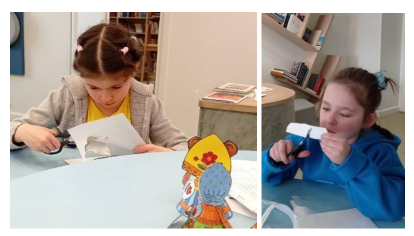
Затем ребята решили попробовать самим сыграть... и у них получилось. И даже появилась идея создать свой театр!

Ответили на вопросы викторины о театре, о профессиях, смежных с театром. Дети сами приняли участие в самодеятельном театрализованном действии: они разыграли сценку сказки «Маша и три медведя». Сначала герои сказки были сделаны своими руками из бумаги в виде конусного настольного театра.